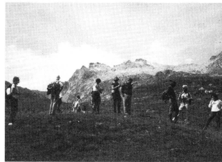
Abstieg von der Fuorcla-Grevasalvas

Das schnelle Postauto brachte uns am anderen Tag dann auf und über den Julier. Wir denken daran: 1869 brauchte die damalige Pferdepost von Chur nach St. Moritz 12½ Stunden. Heute ist die Reisezeit mit dem gelben Postauto auf nicht ganz drei Stunden zusammengeschrumpfen. In Sils trafen sich die drei Ausflugsgruppen. In rassisger Fahrt ging es nun per Postauto den