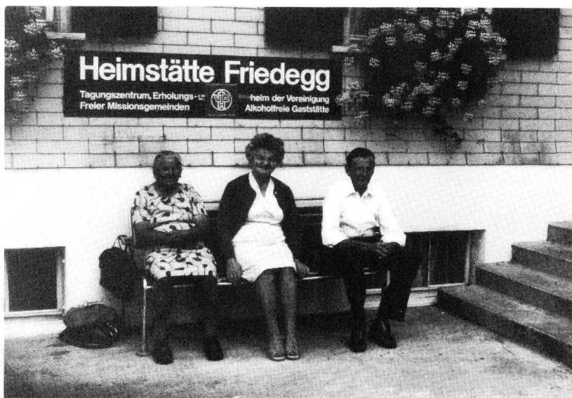
Vor der Heimstätte «Friedegg».