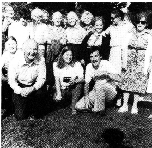
Alle sind versammelt zum Gruppenbild.