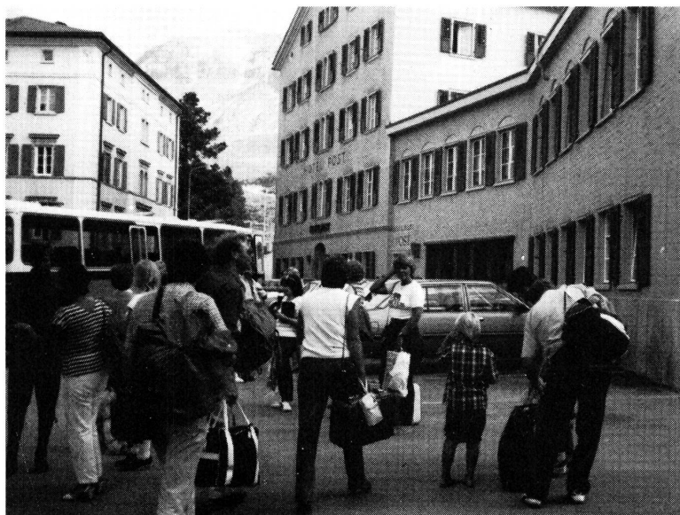
Ankunft in Bivio, Hotel Post.

Alle Telefonanrufe an unser Sekretariat werden über die interne Telefonzentrale an mich weitergeleitet (betrifft auch Schreibtelefon), und das benötigt einige Zeit. Deshalb bitte Geduld haben und das Telefon lange läuten lassen . Vielen Dank.