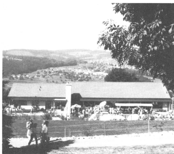
Der Neubau von der Südseite lässt den Blick auf die Landschaft offen.