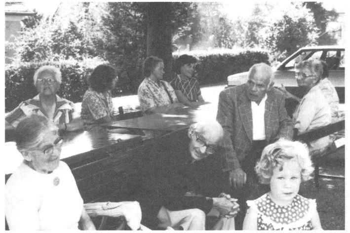
Die ältere Garde sucht Schatten unter den Bäumen.

derte. Für den Werkunterricht musste man ebenfalls andere Räume aufsuchen, da hiefür in der Schule selbst nur ein knapp bemessener Estrichraum zur Verfügung stand. Der Neubau entsprach daher einem dringenden Bedürfnis. Dieser Bau, der aus einem Turnhalle- und einem Werkstättrakt besteht, konnte nach rund eineinhalbjähriger Bauzeit zum Schulbeginn im Frühling dieses Jahres bezogen werden. Den Planern ist es gelungen, auf dem steil abfallenden Gelände ein Gebäude zu erstellen, das sich architektonisch ideal in die Umgebung einfügt und die Sicht auf die Landschaft noch offen lässt. Von der Nordseite her gesehen ist der Bau zweigeschossig, von der Südseite her eingeschossig. Hier wurde zudem ein 17 × 40 Meter grosser Turnplatz angelegt.