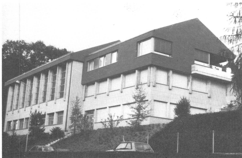
Der Neubau von der Nordseite betrachtet (links: Turnhalletrakt, rechts: Werkstätte-trakt).

Bis heute verfügte die Schule nur über einen kleinen Gymnastikraum, der keinen geordneten Turnunterricht zulies. Der Turnunterricht musste deshalb häufig in fremde Turnhallen ausserhalb der Sprachheilschule verlegt werden, was zeitraubende Hin- und Rückwege erfor-