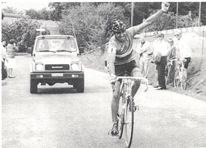
Baguestre (F) jubelt: Europameister.