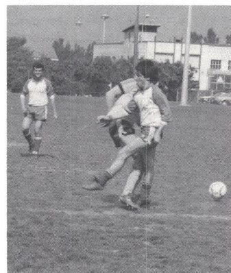
Bern – Luzern: Der Ball ist weg, aber wer foult wen?