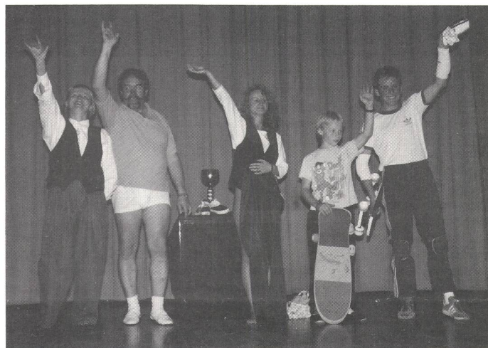
Sie sorgten am Abend mit «hausgemachten» Sketches für Stimmung.