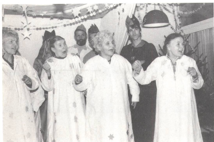
Engel singen das Gebärdenlied «Zu Bethlehem geboren...»

vielen leuchtenden Kerzen am Christbaum bringen richtige Weihnachtsstimmung. Den Anfang machen acht Pensionärinnen, sie singen das Gebärdenlied «Zu Bethlehem geboren». Diese Frauen haben das Lied zusammen mit der