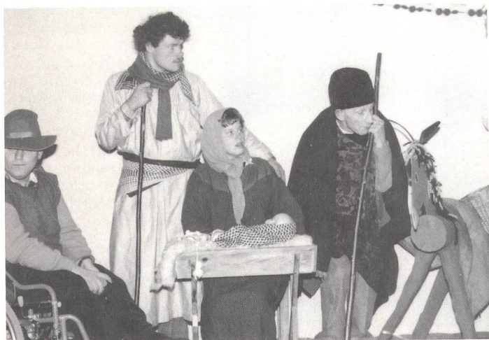
Die Heilige Familie und die Hirten im Stall von Bethlehem

(wag) 20. Dezember 1988: Ein gewöhnlicher Tag ohne besondere Ereignisse. Aber doch nicht ein gewöhnlicher Tag für die Pensionäre der Stiftung Schloss Turbenthal. Denn heute feiert man im Heim gemeinsam mit dem Personal und der Heimkommission Weihnachten. Auch die GZ war dabei. Die Eindrücke sind kaum zu schildern. Aus dem Herzen gesprochen, haben Pensionäre mit ihrer Darbietung die Weihnachtsfeier aktiv mitgeprägt.