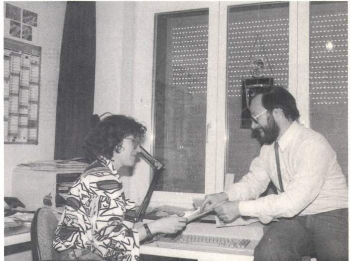
Miteinander geht es besser, das meinen die GZ-Redaktoren.

leute in der Gehörlosendarbeit. Angesprochen sind auch Vereine, Verbände, Institutionen und dergleichen. Nutzen Sie das Angebot. Wann hatten Sie das letzte Mal Ihre Füllfeder in den Händen?