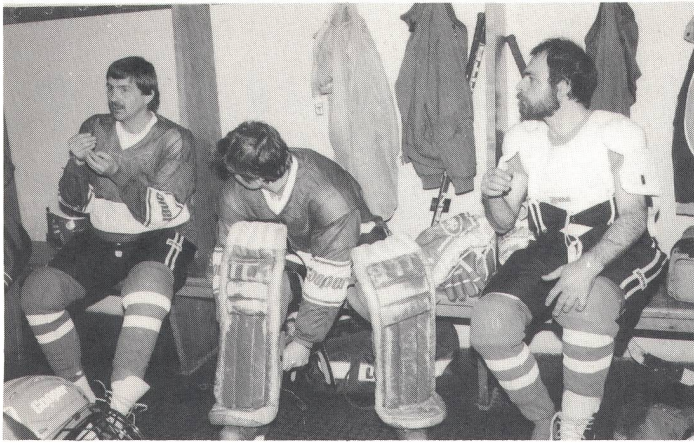
Taktische Anweisungen während dem Umziehen.

Sport. Für die Eismiete werden oft überrissene Preise verlangt, meistens verrechnet man dazu noch Gebühren für die maschinelle Eisreinigung. Wegen Überlastung der Eisbahn (auch das Publikum will eislaufen) können die Innsbrucker Gehörlosen jeweils nur am Samstagvormittag auf das Eis. Der Tarif pro Stunde beträgt knapp 1300 Schilling (= 160 Franken), doch die Eisbahndirektion zeigt sich grosszügig und lässt diesen Tarif für 90 Minuten gelten. Die Ausrüstung ist eigen, Spenden und Sammlungen machten die Anschaf-