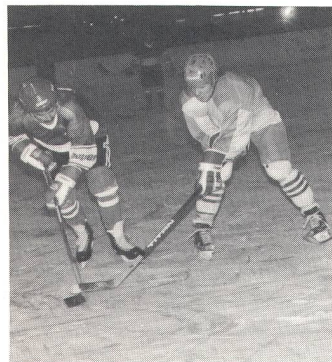
EC Tirol (rechts) ist in Scheibenbesitz.

Sport. Für die Eismiete werden oft überrissene Preise verlangt, meistens verrechnet man dazu noch Gebühren für die maschinelle Eisreinigung. Wegen Überlastung der Eisbahn (auch das Publikum will eislaufen) können die Innsbrucker Gehörlosen jeweils nur am Samstagvormittag auf das Eis. Der Tarif pro Stunde beträgt knapp 1300 Schilling (= 160 Franken), doch die Eisbahndirektion zeigt sich grosszügig und lässt diesen Tarif für 90 Minuten gelten. Die Ausrüstung ist eigen, Spenden und Sammlungen machten die Anschaf-