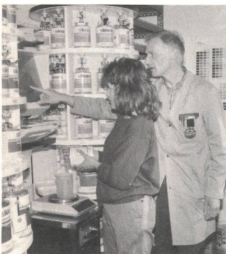
Farbton ausmischen am Computer zusammen mit dem Chef.