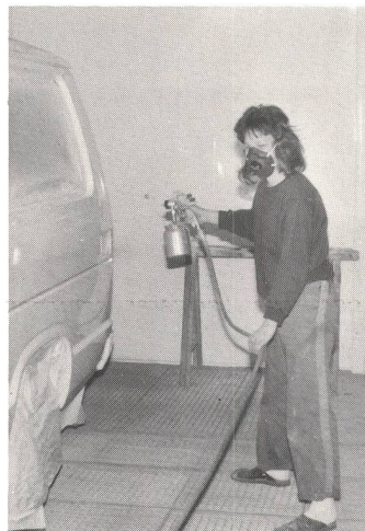
Spritzen mit der Maske.