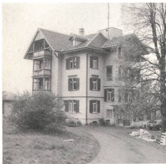
Das GHE-Haus an der Hömelstrasse in Wald.

Wie entsteht ein Telescrit? Welche Bausteine werden benötigt? Von 10 bis 13 Uhr erhielten die Besucher einen fundierten Einblick in die Produktionsräume. Keine Fließbandarbeit an der Hömelstrasse, alles exaktes Handwerk, ausgeführt durch geschulte Elektroniker. Neben der Werkstatt befindet sich der Raum für die Teletext-Untertitelungswerkstatt. Das Haus an der Hömelstrasse ist seit etwa einem Jahr Eigentum der GHE. Es konnte dieses Gebäude vom Schweizerischen Arbeiterhilfswerk zu günstigen Konditionen übernehmen. Soviel zum «Tag der offenen Türe».