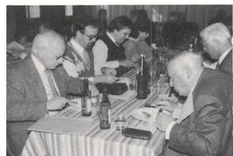
Beim gemeinsamen Imbiss.