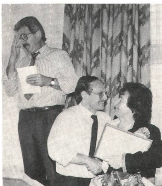
Vizepräsident von Arx (links): «Oh, da schaue ich lieber nicht hin.»

– Deutlich nachweisbare Verschlechterung der Fahrfähigkeit