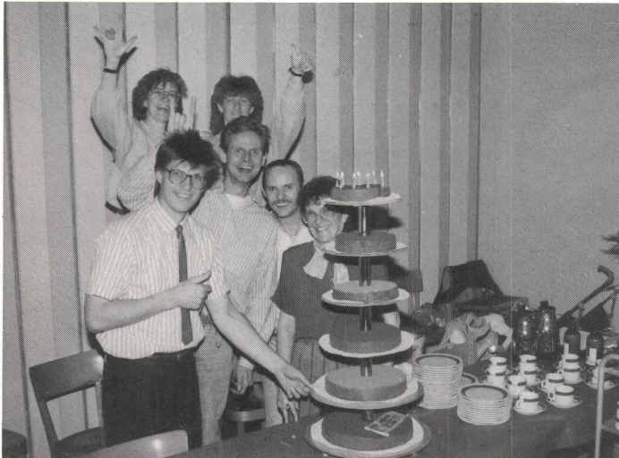
Der ZGV-Vorstand hat wirklichen Grund zum Ausflippen . . .

(wag) Erster Akt: Im Anschluss an seine 10. Generalversammlung offeriert der Zürcher Gehörlosenverein den Teilnehmern einen Imbiss inklusive Dessert und Kaffee zu einem Spottpreis von nur einem Fünfliber. Der zweite Akt folgt am 23. September, wenn der ZGV den «Tag der Gehörlosen» und dazu auch die Abendunterhaltung organisieren wird. Und die Fakten der Generalversammlung 1989: Eine rein statutarische Angelegenheit.