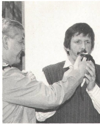
«Tüchtig blasen in das berüchtigte Röhrchen.»

– die Einnahme von Medikamenten die Wirkung des Alkohols verstärkt. Bei starken Medikamenten (auch ohne Alkohol) muss der Arzt entscheiden, ob man überhaupt autofahren darf.