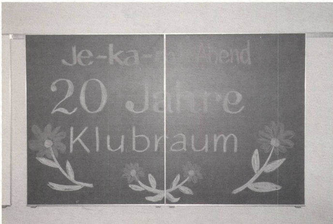
Hier war der Künstler Rainer am Werk.