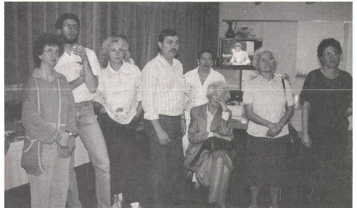
Die Aufmerksamkeit gilt diesmal nicht dem TV-Nachrichtensprecher.