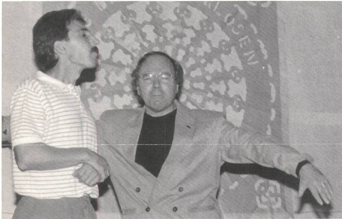
Szene aus dem Theater: Der Lehrer (rechts) tadelt den Schüler, weil er gebärdet.

(wag) Zürich und Samstag, 30. September 1989: Ein prächtiger Spätsommertag: das Volk flippiert aus. Kolonnen auf der Seepromenade, Ruhe dagegen im Quartier. Mehr Menschen als üblich an der Oerlikonerstrasse, dort, wo das Zürcher Gehörlosenzentrum steht. Der «Tag der Gehörlosen» lädt nämlich ein. Ein gelungener Anlass darf man sagen, aber so richtig ins Schwarze getroffen hat man wieder auch nicht.