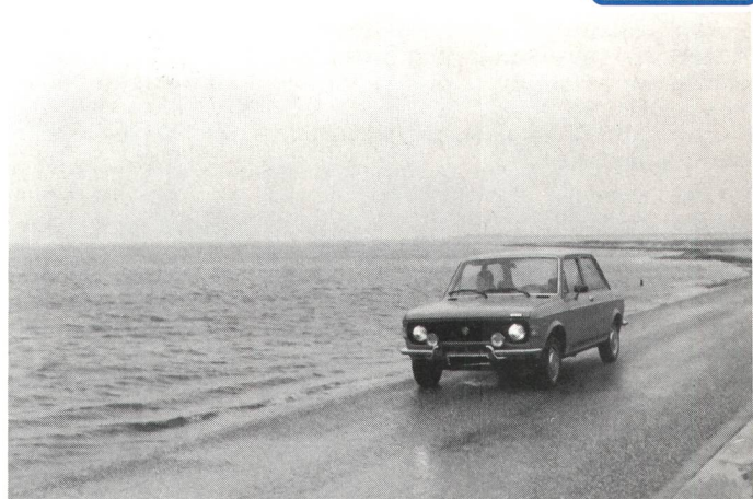
Motiv: Mit dem Auto direkt ans Meer

Der Anlass «150 Jahre Photographie» gab den Ausschlag, dass wir in diesem Sommer einen Fotowettbewerb ausgeschrieben haben. Wir waren recht optimistisch und erwarteten eine hohe Beteiligungsquote. Denn heutzutage besitzt fast jede Person eine Kamera, und gute Schnapsschüsse gelingen auch einem Anfänger. Doch je näher der Einsendetermin für den Fotowettbewerb heranrückte, um so mehr schwanden unsere Hoffnungen. Haben wir uns überschätzt oder haben wir zuviel erwartet? Jedenfalls, ganz enttäuscht sind wir nun auch nicht. Obwohl nämlich nur neun Einsendungen zu registrieren waren, die Wettbewerbsteilnehmer haben mit originellen Motiven verblüfft. Da eben verschiedene Motive zur Auswahl standen, hatte es die Jury nicht leicht, den Hauptpreisgewinner zu ermitteln. Es musste nämlich Rücksicht genommen werden auf das ausgeschriebene Wettbewerbs-Thema «Entdeckt und erlebt». Auf dieser Seite publizieren wir die Fotos der drei Gewinner, dazu noch eine Auswahl der weiteren eingesandten Bilder.