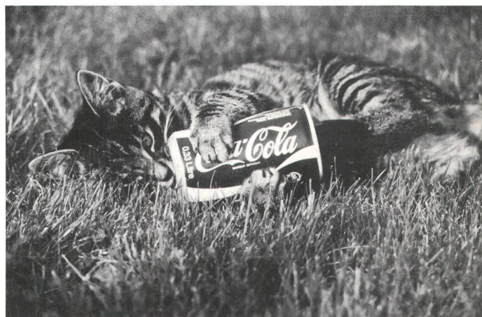
Motiv: Spielende Katzen oder «Coca-Cola ist überall dabei. . .»