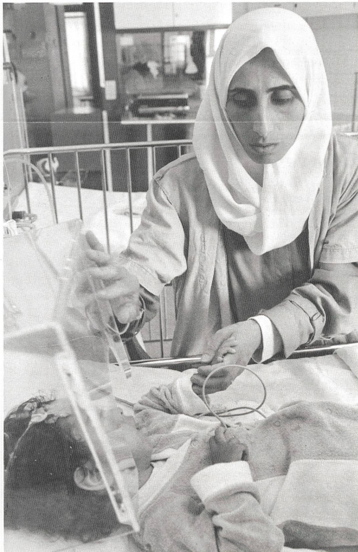
Mut für den Alltag gibt Bethlehem das Baby Hospital.

Auch in Bethlehem ist der Alltag wieder eingeehrt. Feststimmung war überhaupt nicht aufgekomen. Zu gross sind die Sorgen seiner Bewohner, zu schwer die Bürde der Besetzung. Es war nicht mein erster Besuch in Bethlehem. Aber erstmals tat ich vor einem Monat einen Blick hinter die Kulissen. Bethlehem hat mit der Stadt Davids vor 1991 Jahren viel gemeinsam.