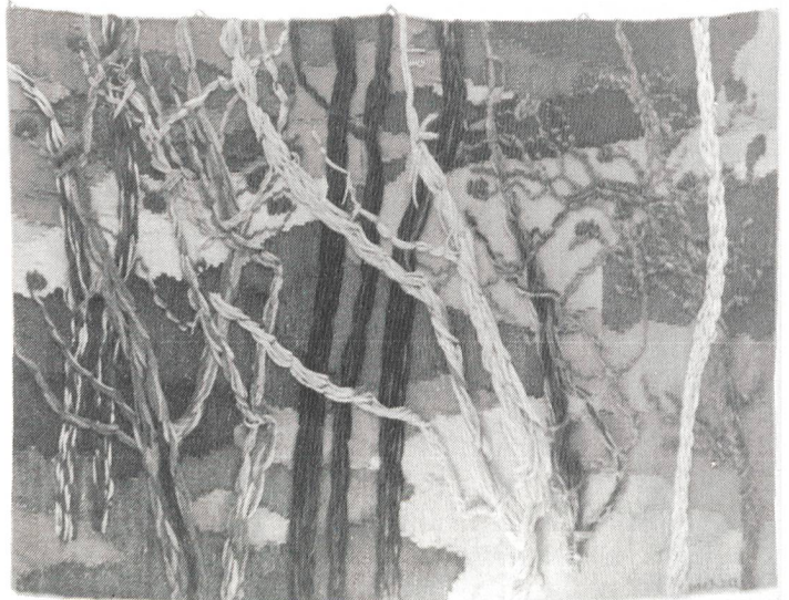
Sonnenuntergang im Dschungel (Webbild)