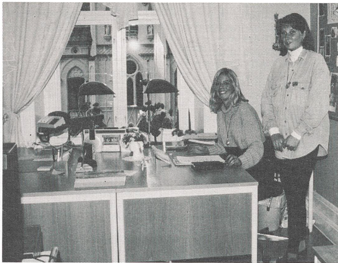
Zwei schwedische Dolmetscherinnen in ihrem Büro auf der Vermittlungsstelle in Örebro.