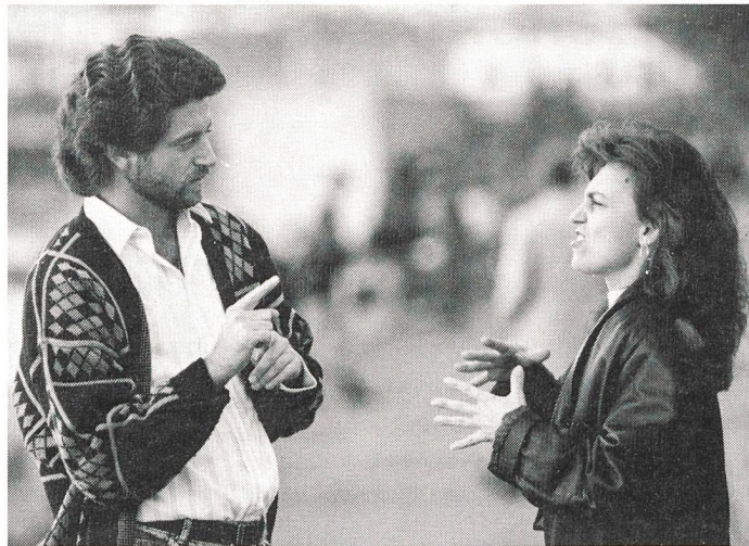
Immer mehr Hörende öffnen sich der Gebärdensprache und sind an Informationen interessiert.

Anlässlich der internationalen Sportveranstaltungen erreichten unsere Sportler und Sportlerinnen gute Resultate. Bei den Winterspielen in Banff/Kanada brachten sie für die Schweiz zwei Gold- und eine Bronzemedaille nach Hause. In Stavanger/Norwegen holte die Damenmannschaft im Geländelauf eine Goldmedaille. Anlässlich der Leichtathletik-EM von Vladimir haben einige Sportlerinnen und Sportler Schweizerrekorde erreicht. Wir danken allen Aktiven für ihren Einsatz, für den sie einen grossen Teil ihrer Freizeit opfern mussten. Höhepunkt des Jahres 1991 war der «Tag der Gehörlosen» in St. Gallen vom 28. September. Einen besonderen Dank richte ich an unsere Sportler, die sehr viel zum guten Gelingen dieses Anlasses beigetragen haben.