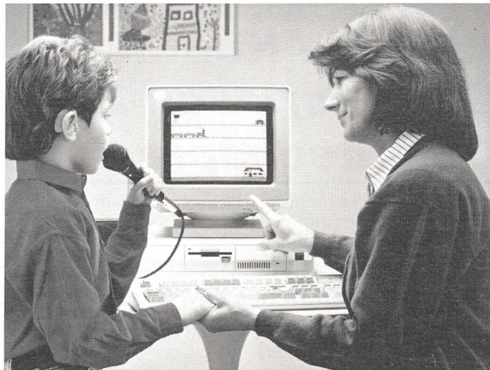
Mit dem IBM SpeechViewer II werden gesprochene Konsonanten, Vokale, Silben und ganze Wörter auf dem Bildschirm in Form von Bildern und Diagrammen sichtbar.

Die traditionellen Artikulationsübungen bei kleinen Kindern kann der Computer nicht gänzlich ersetzen. Sobald eine Artikulation jedoch eingebaut worden ist, kann man mit SpeechViewer sehr gut darauf aufbauen.»