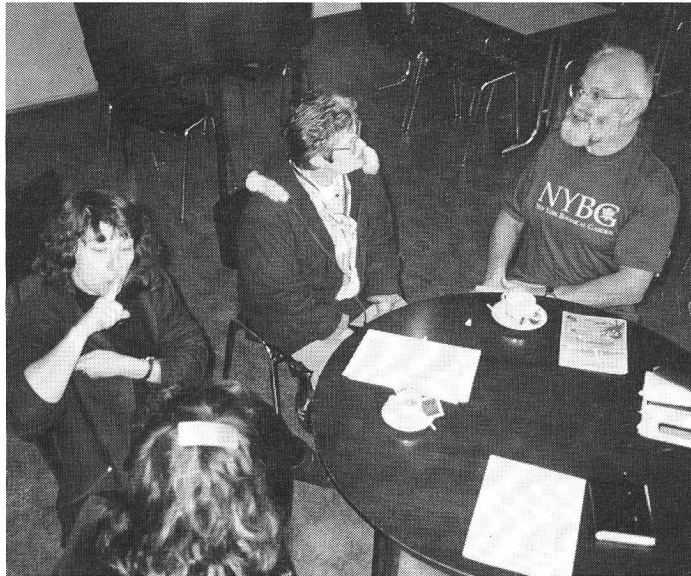
Gespräch am runden Tisch mit dem berühmten Autor.