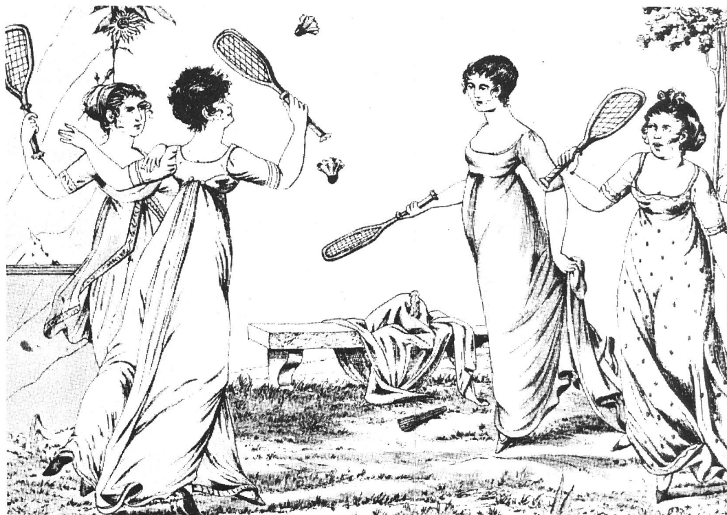
Mädchen, die zum Zeitvertreib Federball spielen (etwa um 1800)

Bisher wurden nur Weltmeisterschaften in den verschiedenen Ländern ausgetragen, bis im Jahre 1988 die Sportart Badminton als Demonstrationswettbewerb in Seoul/Korea eingeführt wurde. Letztes Jahr wurde Badmin-