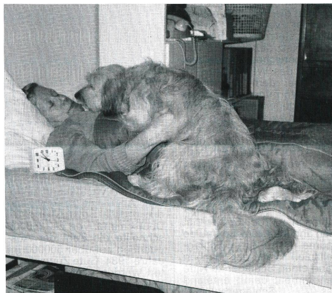
Gabrielle Nobs mit ihrer Demonstrationshündin «Chinnor».

Obwohl die Hunde nach der Ausbildung gratis zur Verfügung gestellt werden, ist die Nachfrage in der Schweiz bis jetzt sehr gering. In den USA und England ist die Nachfrage hingegen gross.