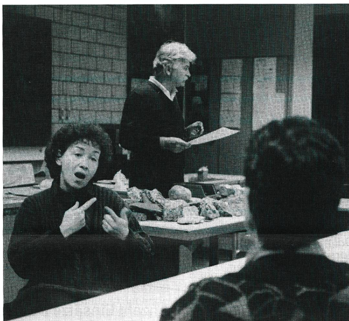
Immer häufiger stehen die Dolmetscherinnen des SVG im Einsatz. Die Gesuche steigen jährlich, obwohl noch längst nicht alle Gehörlose den Vermittlungsdienst kennen und benutzen.

Im Mai 1985 wurde mit der Vermittlung von Dolmetschern begonnen. Der SVG griff damit einen Antrag des damals noch existierenden Gehörlosenrates auf. Die Dolmetscher und Dolmetscherinnen der ersten Stunde leisteten Pionierarbeit und begannen mit den ersten offiziellen und bezahlten Dolmetschereinsätzen, noch ehe es eine Dolmetscherausbildung gab. Ihre Dolmetscherfähigkeiten hatten sie im täglichen Umgang mit Gehörlosen gelernt. Zum Beispiel als Lehrer/-innen und Erzieher/-innen an Gehörlosenschulen,