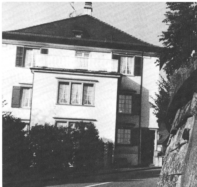
Das Ostschweizer Wohn- und Altersheim für Gehörlose in Trogen.

1972 wurde das derzeitige Heimleiter-Ehepaar vom Stiftungsrat und von der Heimkommission gewählt. Zum zwanzigjährigen Jubiläum hält der Präsident der Heimkommission dankbar Rückschau: «Die beiden Gremien