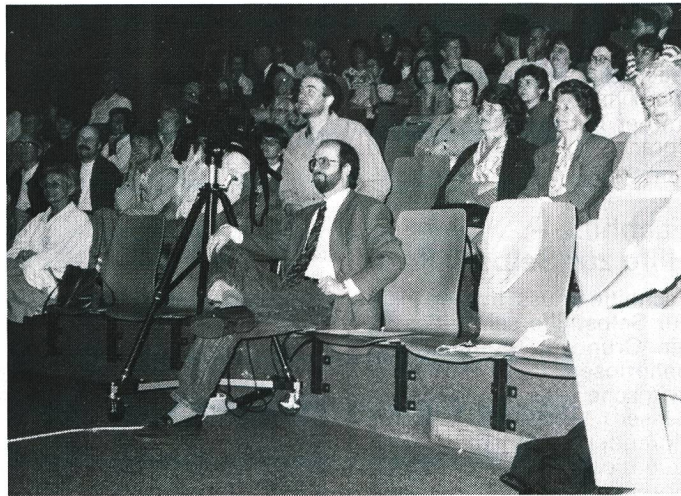
Gespannt verfolgten die Anwesenden die Generalversammlung des Fürsorgevereins.