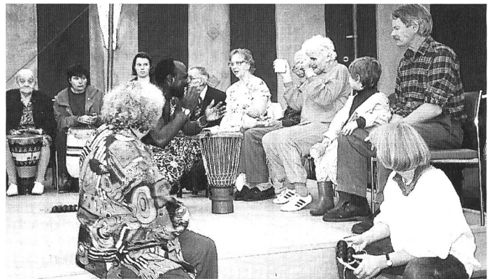
Das Trommelspiel begeisterte Spieler/-innen und Publikum gleichermassen.

1a/ Am 28. August konnte nach langen Vorbereitungen das Schlossfest steigen. Es war kühl und schwere Wolken hingen am Himmel, doch vor Regen blieben die Turbenthaler verschont. In Turbenthal sollten sich an diesem Samstag verschiedene Kulturkreise, aber auch Gehörlose und Hörende begegnen. Und die 73 Heimbewohner und -bewohnerinnen und die vielen angereisten Gäste wurden mit vielen Darbietungen und feinem Essen für einen Nachmittag in andere Kulturen und Welten eingetaucht.