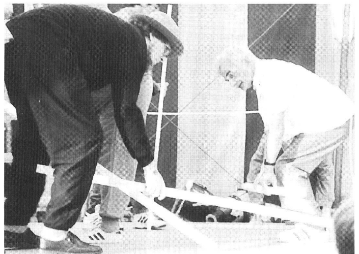
Schlosstheater: Grenzen und Schranken überwinden.

Unter dem Titel «textile Animation» konnten aus farben-