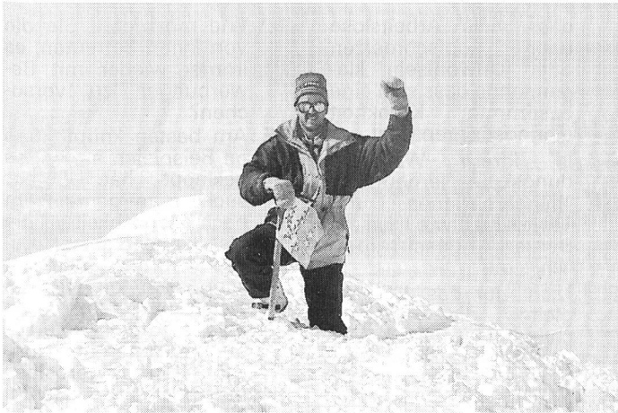
Urban Gundi auf der Parrotspitze (4432m).

In mehr als einem Monat dieses Jahres erlebte ich die schönsten, unvergesslichsten und abenteuerlichsten Skitouren. Bis Anfang Juni bestieg ich schon mehr als 20 Viertausender.