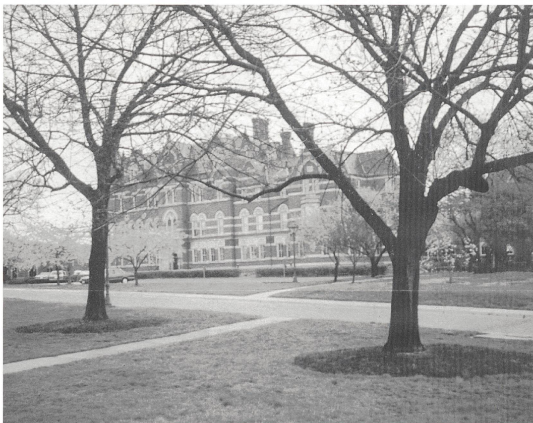
Gallaudet – ein Blick ins Paradies.

An einem Abend habe ich in Gallaudet eine Theatervorstellung mit Musik und Tanz besucht. Während die gehörlosen Schauspieler nach dem Rhythmus der Musik tanzten, deuteten sie gleichzeitig die Worte. Das war wirklich unvergesslich.