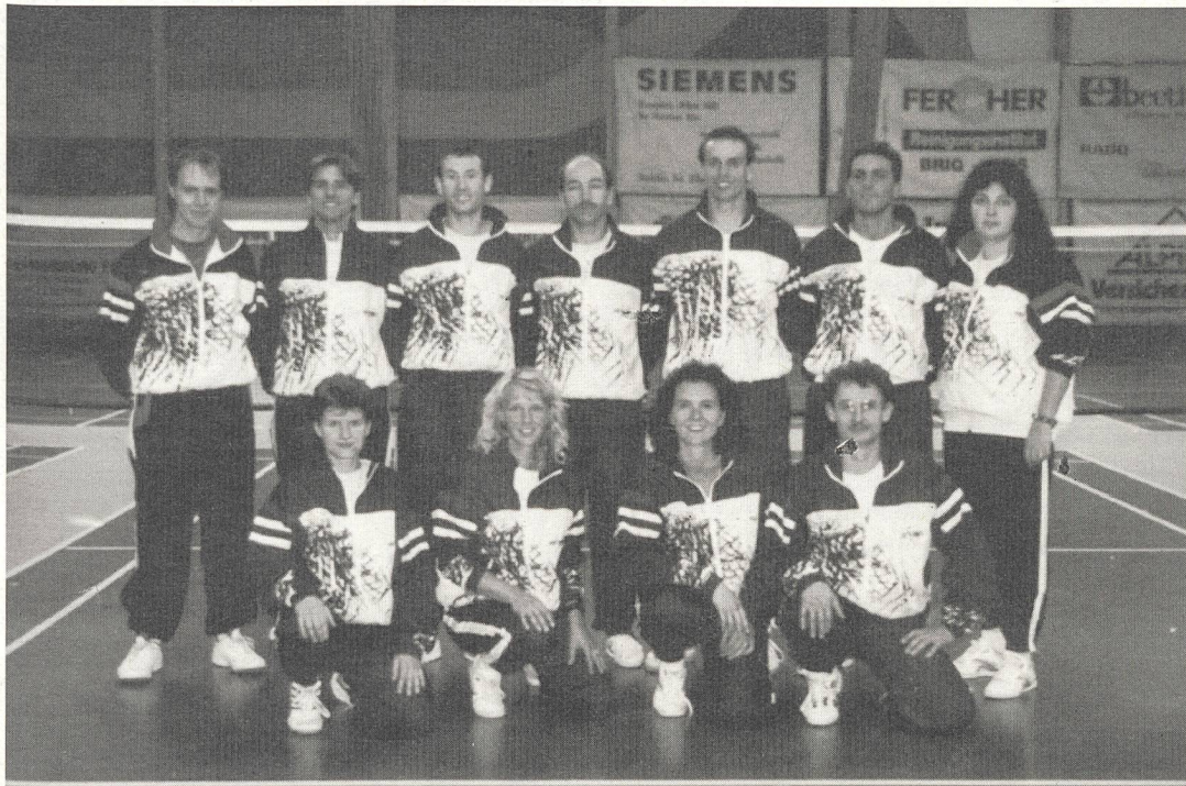
Badminton-Nationalmannschaft für die Europameisterschaft in Dänemark, aufgenommen in Brig.

Vom 23. bis 30. Oktober fand die 2. Badminton-EM in Kopenhagen (Dänemark) statt. 7 Nationen hatten sich angemeldet.