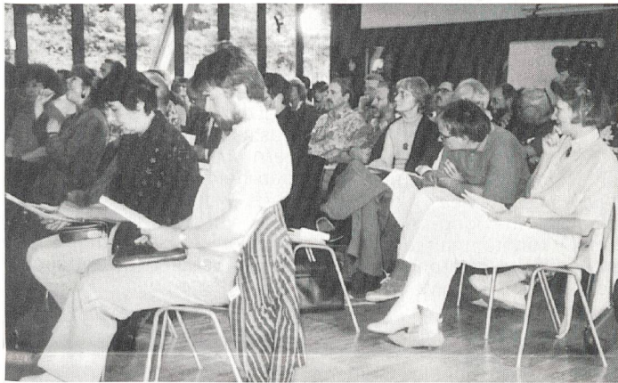
Die Delegierten studieren den Entwurf der neuen Statuten, die nicht in Kraft gesetzt wurden.

Vertreterinnen und Vertreter von SVG, SGB, der Elternvereinigung dankten dem zurücktretenden Präsidenten für sein grosses Engagement, seine Weitsicht und für seine vermittelnde Art. «Hart in der