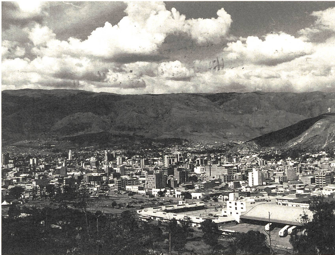
Das Zentrum von Cochabamba. Im Hintergrund 4500 – 5500 m hohe Gebirgszüge.

kommt. Wir fragen jemanden vom Personal: das Gepäck sei jedenfalls direkt weitergeleitet worden aufs neue Flugzeug... wir rennen zurück, fünf Minuten vor Abflug stehen wir am Tor zum Eingang des Flugzeugs. «Gestürm», weil, so sagen sie, unsere Zollformulare nicht in Ordnung sind.