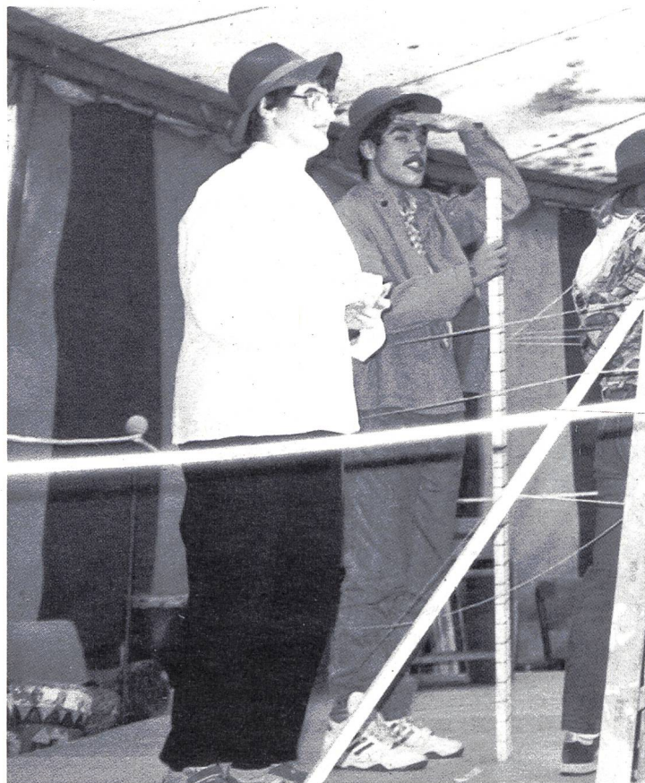
Die Stiftung Schloss Turbenthal hielt Ausschau nach neuen Formen: Das Projekt «Gehörlosendorf» ist auf gutem Kurs.

gg/Was sich Anfang der 90er Jahre abzeichnete, hat sich noch verstärkt. Das Spendenbrünnelein fließt nicht mehr so munter. Beratungsstellen, Heime, Fürsorgevereine müssen ihre Anstrengungen verdoppeln, um für ihre vielfältigen Aufgaben die nötigen Finanzen zu erhalten. Gute Ideen sind gefragt.