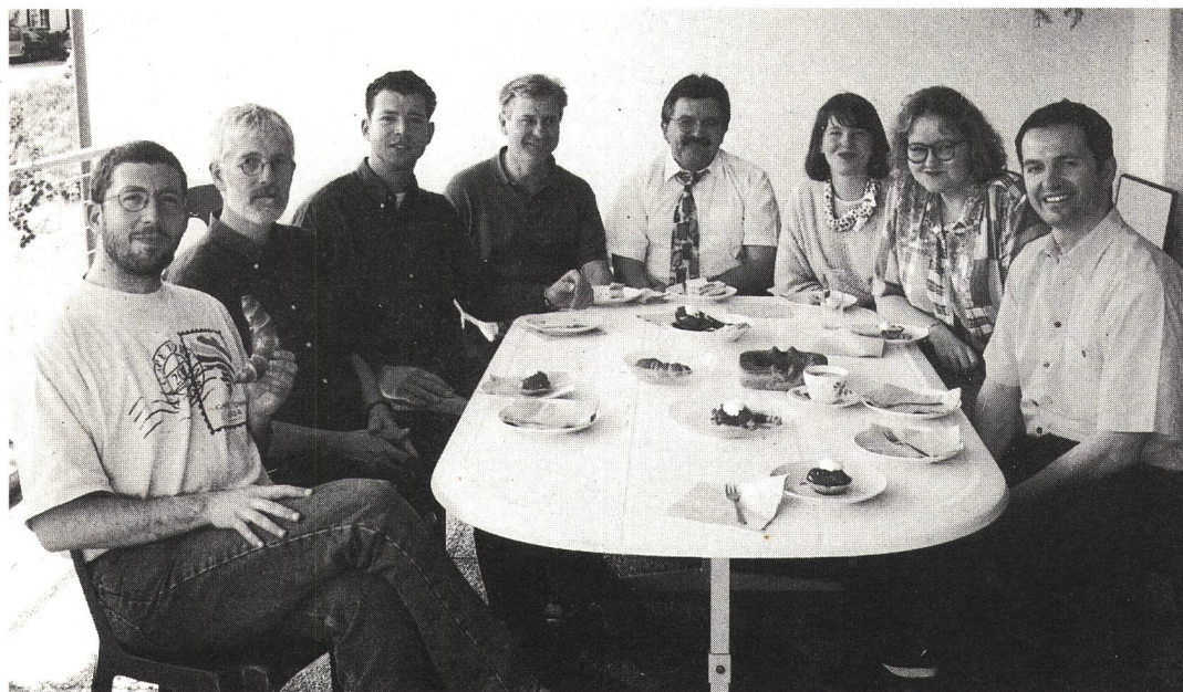
Die Teilnehmer des ersten IWAG-Seminars