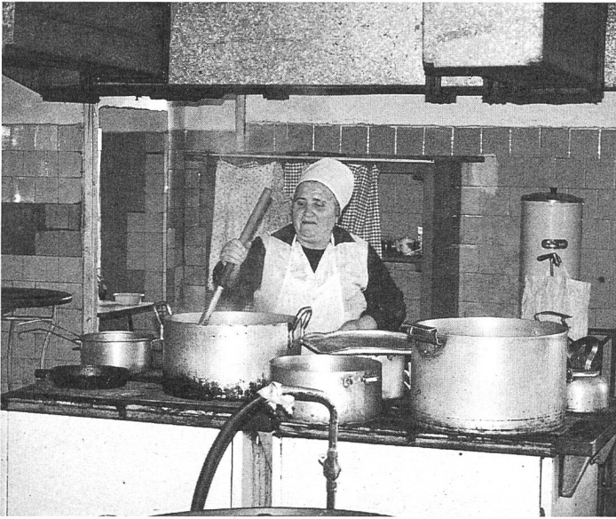
Die Küche wie auch die sanitären Anlagen befinden sich in einem schlimmen Zustand.

kommen, sind die Gänge eiskalt. In den Toiletten herrscht ein Gestank, der einen ohnmächtig werden lässt. Sie können sich auch nicht ausdenken, wie viele Fliegen sich da tummeln, wenn der Frühling kommt. Es ist unbeschreiblich.