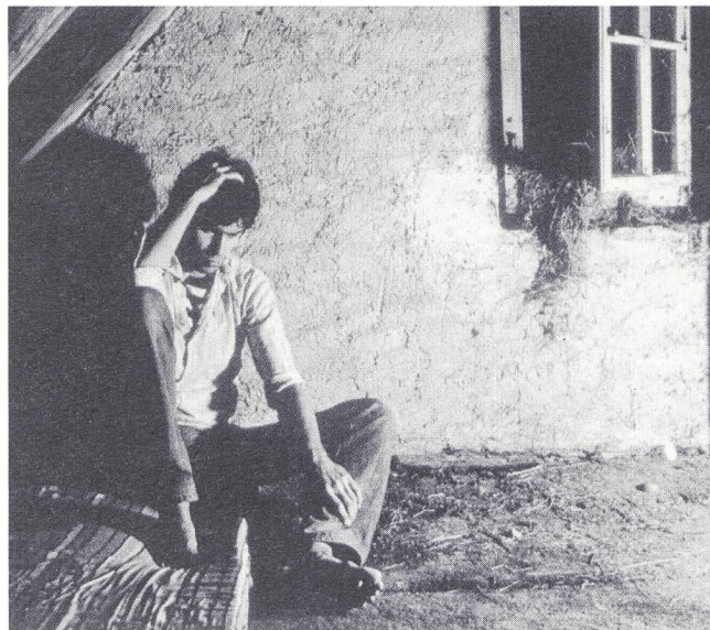
So stellte sich der Fotograf vor 17 Jahren in einem Selbstbildnis dar.

Spörri inszeniert seine Modelle in ungewohnten Umgebungen. Eine ölverschmierte Autowerkstatt, der kleine Balkon einer Stadtwohnung und ein Felsvorsprung auf dem Furkapass sind einige der Schauplätze.