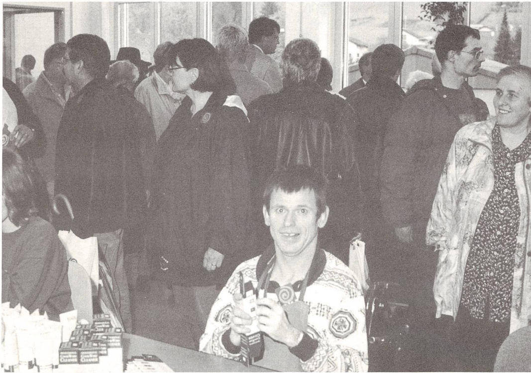
Die Dienstleistungen der Belegschaft der Werkstatt des Gehörlosendorfes sind vielseitiger Art. Hier werden Verpackungsarbeiten demonstriert.