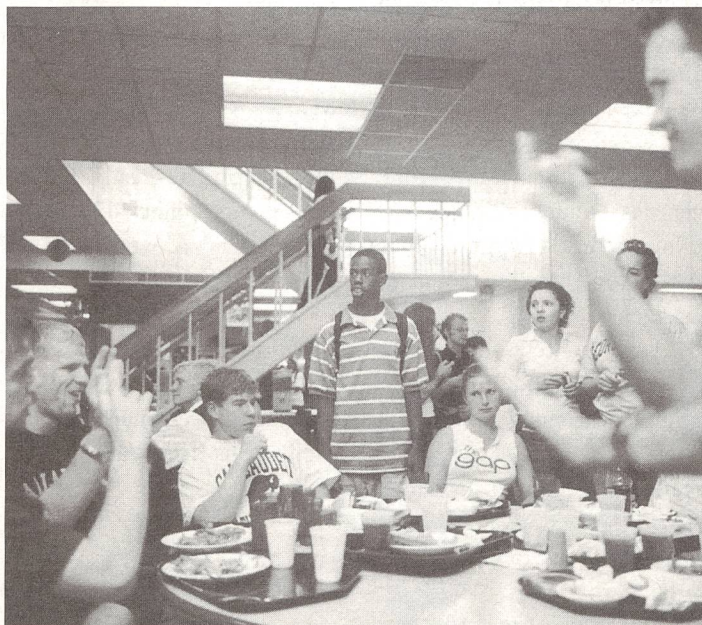
Gesellschaftsleben – reger Gedankenaustausch in der Cafeteria