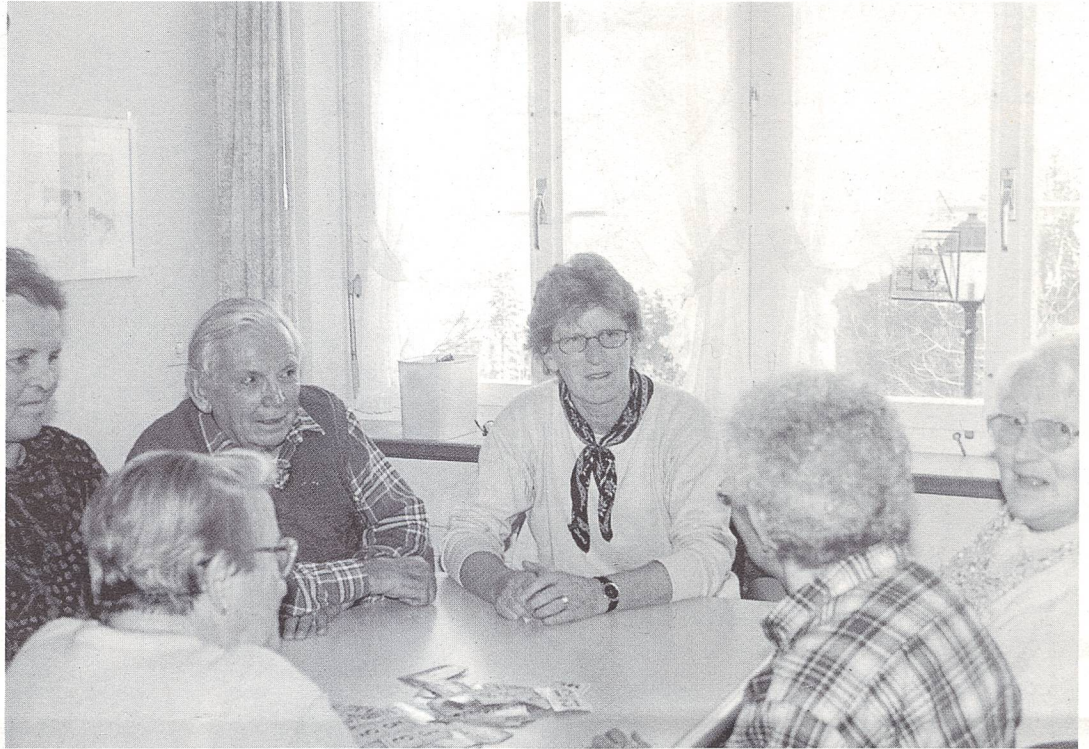
Die Heimleiterin (Mitte) hat immer ein offenes Ohr für die Anliegen der Pensionäre.