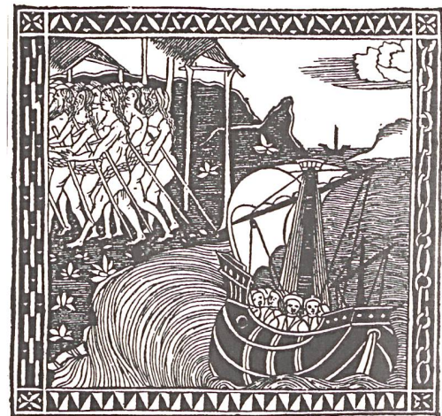
Fiehende Indianer vor Columbus. Holzschnitt in „Giuliano Dati“, Florenz 1495. Monographie rororo.