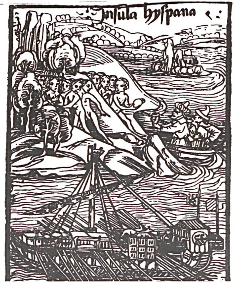
Die Landung auf Hispaniola. Holzschnitt in „Epistola Christofori Colom“, Rom 1493. Monographie rororo.