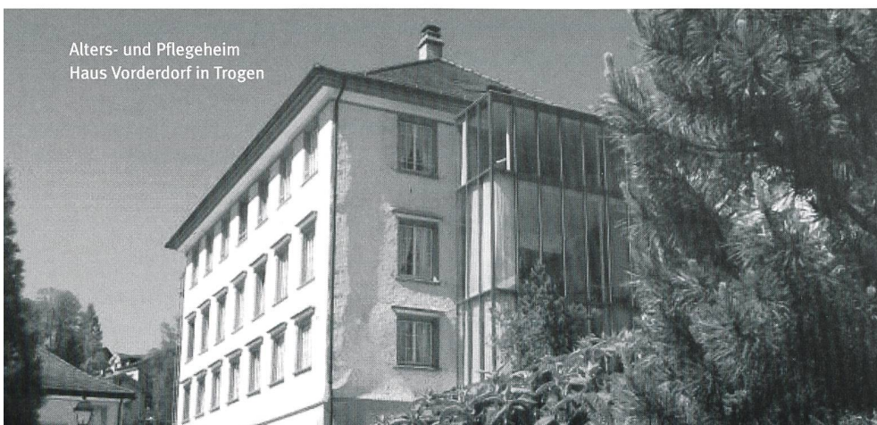
Alters- und Pflegeheim Haus Vorderdorf in Trogen