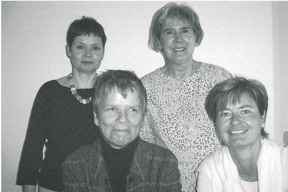
Das Team der Beratungsstelle St. Gallen: