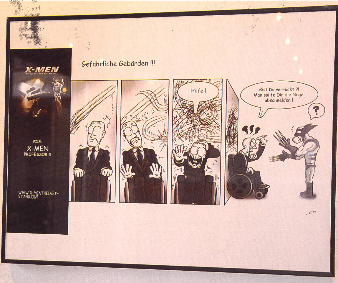
Die Wurzel der Sprechblasen von Hörenden ist in Form eines Pfeils dargestellt. Diejenigen der Gehörlosen werden abgeschnitten, um die Gebärden darzustellen.