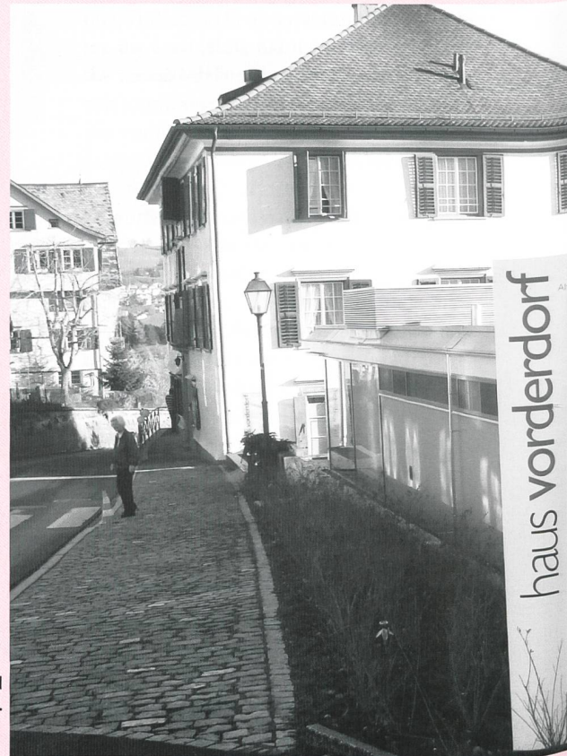
Gelungen Symbiose: Alt- und Neubau harmonieren perfekt.

Nach dem Apéro und dem gemeinsamen Mittagessen besteht die Möglichkeit das neu gestaltete Haus Vorderdorf bei einer Hausführung genauer kennen zu lernen.