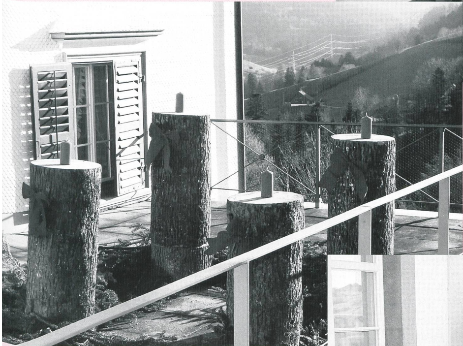
Und ein Haus, wo Traditionen einen festen Platz haben.