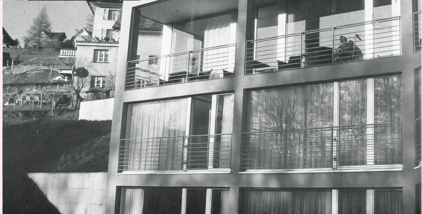
Das Haus Vorderdorf, ein Ort wo sich Seniorinnen und Senioren wohlfühlen können und wo sie professionell betreut werden.