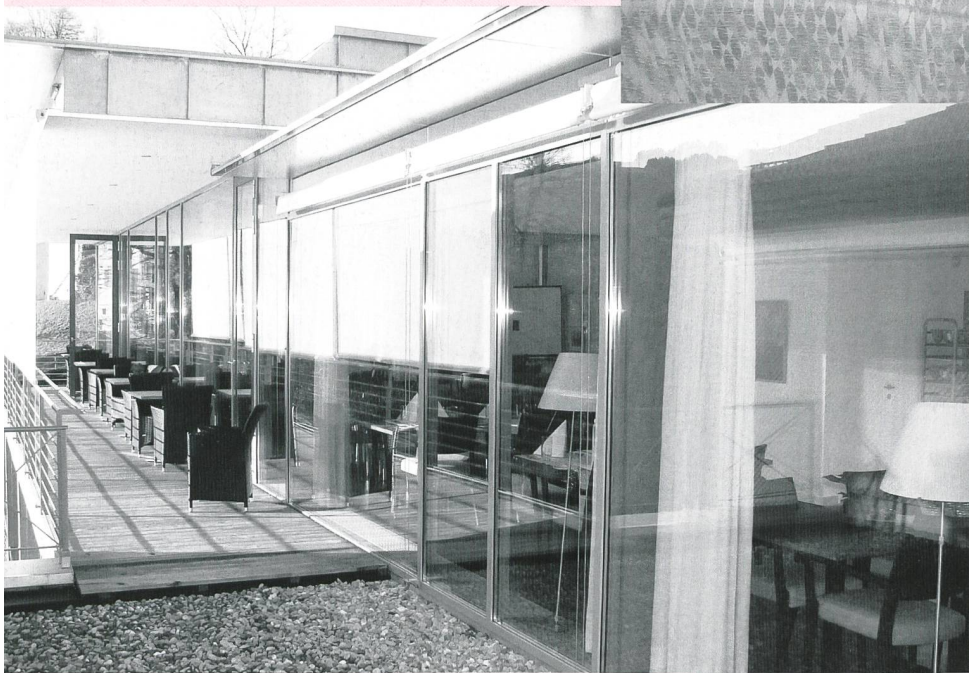
Die Terrasse der Cafeteria lädt bei Sonnenschein zum Verweilen ein.