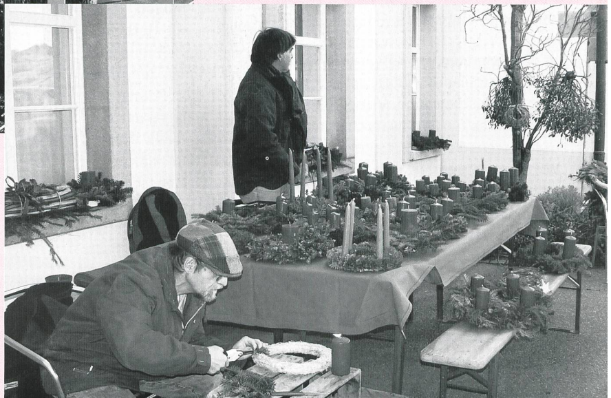
Von den Bewohnern kunstvoll gestaltete Adventskränze werden zum Verkauf angeboten.