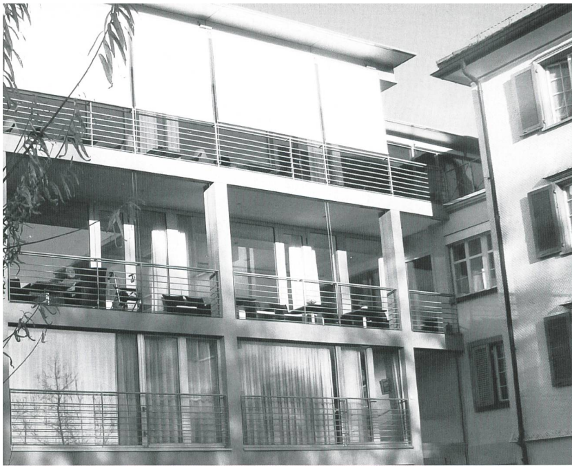
Der moderne und helle Neubau mit attraktiven Alterswohnungen.