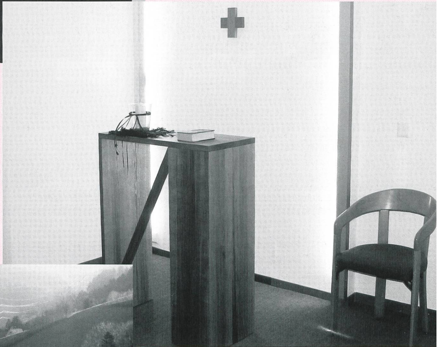
Liebevoll und schlicht gestalteter Andachtsraum. Ein Ort der Stille und der Besinnung für die Bewohnerinnen und Bewohner im Haus Vorderdorf.