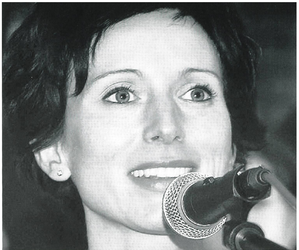
Pascale Bruderer Wyss, Nationalratspräsidentin und für ein Jahr höchste Schweizerin.

Pascale Bruderer Wyss betont, dass sie ihr Präsidentschaftsjahr gezielt auch dafür verwende, die Gebärdensprache für eine breitere Bevölkerungsschicht sichtbar zu machen. Auf diese Weise können die Anliegen der Gehörlosengemeinschaft von den Hörenden besser verstanden werden. Ihre