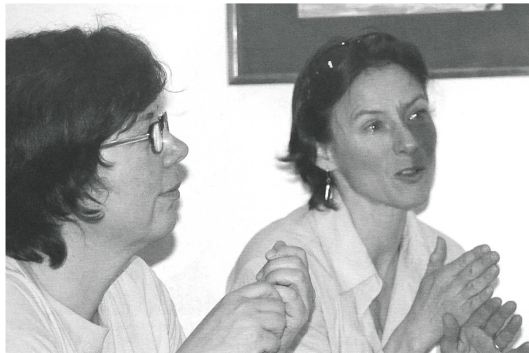
Die Teilnehmenden diskutieren angeregt.