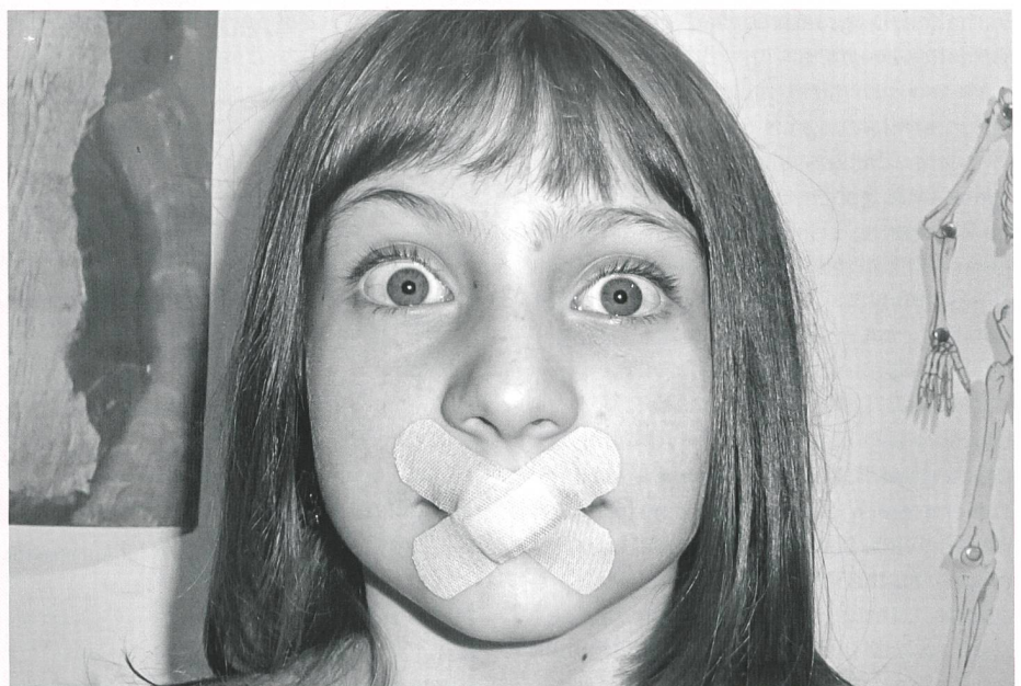
Erzwungenes Schweigen ist die stärkste Waffe der Täter.

Die Aussagen von Gewaltbetroffenen werden immer wieder in Zweifel gezogen. Dies entspricht einer bekannten Täterstrategie und wird als Neutralisierungsstrategie bezeichnet – dieses Verhalten ist nur denkbar weil sich viele Menschen täterloyal verhalten. Jede zweite gehörlose Person erlebt sexualisierte Gewalt (Dietzel 2004). Die Behinderung hat sich dabei als deutlicher Risikofaktor für sexualisierte Gewalt erwiesen. Der Begriff «sexualisierte Gewalt» verdeutlicht, dass sich die Täter des Sexuellen «bedienen», wenn sie ihre Verbrechen begehen – während «sexuell» für einvernehmliche intime Begegnungen steht. Eine klare Wortwahl bringt das Unrecht der Taten zum Ausdruck.