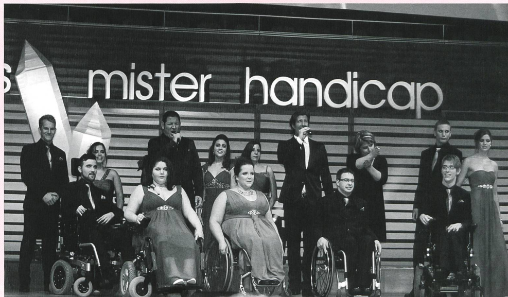
Grandiose Stimmung bei den Kandidatinnen und Kandidaten und beim Publikum im KKL.