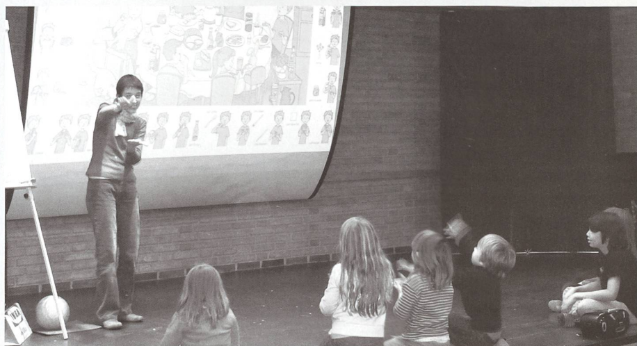
Kinder beim Erlernen der Gebärdensprache anhand des neuen Buches.

Im Anschluss referiert Marina Ribeaud über die Visuellpädagogik. Diese Form der Pädago-