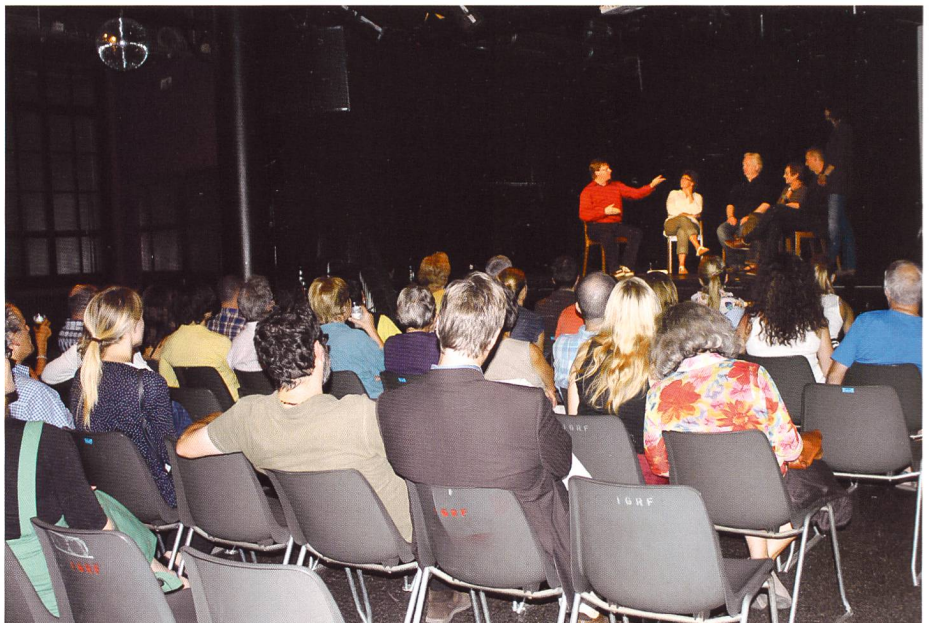
Volle Aufmerksamkeit im Publikum.