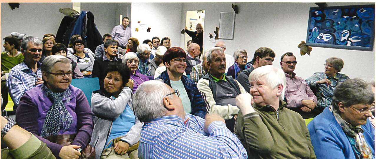
Mit grossem Interesse verfolgen die Besucherinnen und Besucher die Beiträge der verschiedenen Referenten.