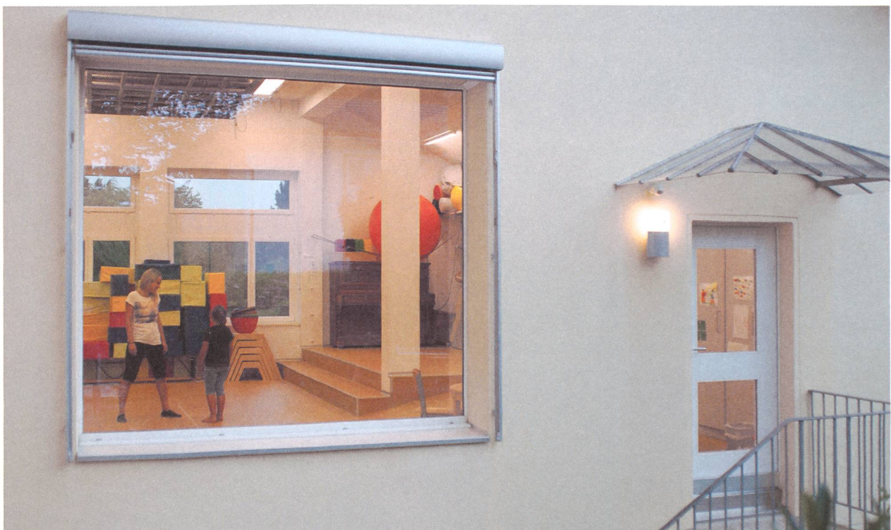
Blick ins Zentrum: Psychomotoriktherapeutin Seline Bieri und ein Mädchen arbeiten im Bewegungsraum des Erdgeschosses.