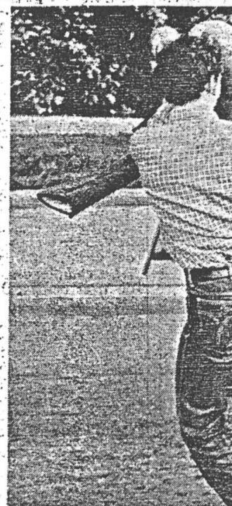
Place de la Riponne : « on » e

Organisée par le mouvement Lausanne bouge, une manifestation réclamant un lieu de rencontre pour les jeunes, a réuni samedi après-midi à la place de la Palud, près de 200 personnes. Si au début le rassemblement s'est fait dans le sourire et le calme, dès que la foule s'est mise en marche des slogans ont été scandés montrant sa volonté de se solidariser avec la jeunesse zurichoise.