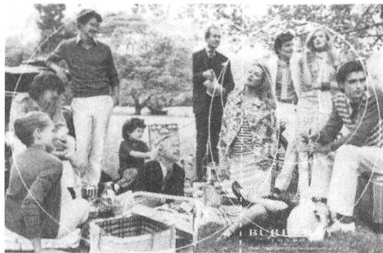
Abb. 2: Bohnsack 2009, S. 62

des Lernens, der Sozialisation und der Bildung (auch außerhalb der Massenmedien) Medium alltäglicher Verständigung und alltäglichen Handelns sind» (28). Dass aber «soziale Situationen oder Szenen in Form von mentalen Bildern gelernt werden, die u. a. im Medium des Bildes erinnert werden» (28; Herv. M. R. M.), ist eine überaus eng gefasste Rechtfertigung der sozialwissenschaftlichen Relevanz von Bildanalysen, die nicht zuletzt Bohnsacks eigenem Anspruch kaum gerecht werden dürfte, die «Ikonizität» (27) auch alltäglicher Bildproduktionen zu erfassen. Nicht nur, dass das Buch die Konstitution von «mentale[n] oder psychische[n] Bild[ern]» (29) im Verhältnis zur medialen Materialität (picture) und ikonischen Sinnhaftigkeit (image) dokumentarisch zu untersuchender gesellschaftlicher Bildproduktionen ungeklärt lässt. Auch umgekehrt gerät die, noch für Panofskys Ikonologie und Imdahls Ikonik